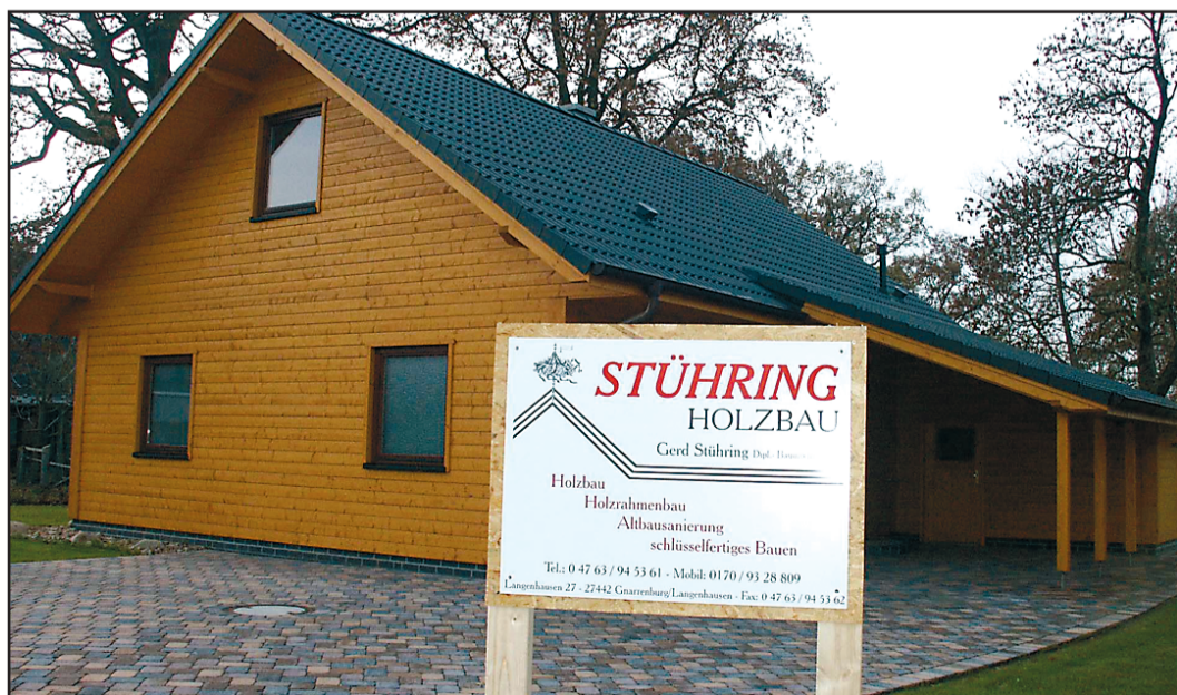
In Kutenholz entstand dieses schicke Einfamilienhaus im letzten Winter.