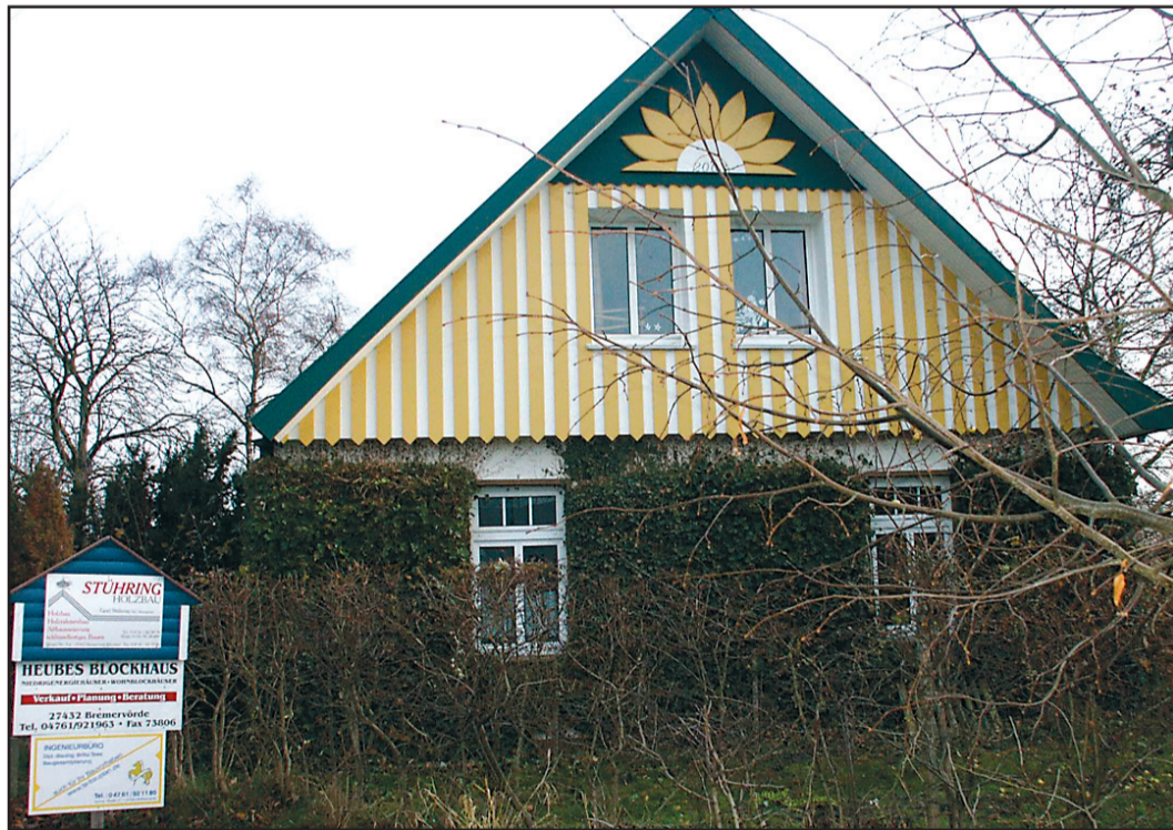
In Frankenborstel bei Zeven entstand diese bildschöne und einmalige Giebelsanierung.