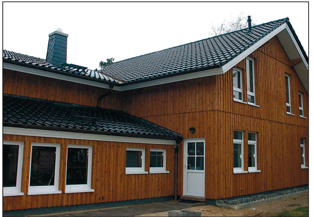
Auch dieses schicke Eigenheim in Holzrahmenbauweise entstand im letzten Jahr in Klenkendorf.